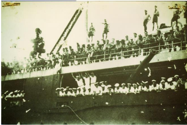
Port de Papeete – 21 avril 1941

Dès l'annonce de l'armistice signé par le Maréchal Pétain et dès l'Appel du 18 juin 1940, les Polynésiens ont manifesté avec force et détermination leur volonté d'aller se battre pour aider la France à se relever.