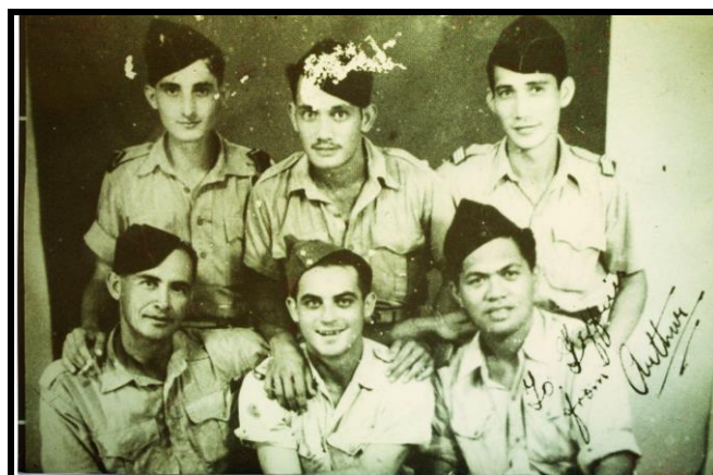
Photos souvenirs des anciens combattants polynésiens du Bataillon du Pacifique