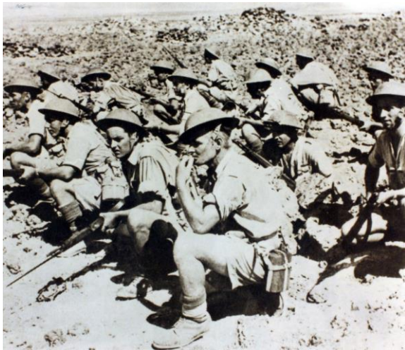
Combats en Libye

D'août à décembre 1941, c'est la veillée d'armes au Proche-Orient. Le premier bataillon du Pacifique y perçoit du matériel, en même temps qu'il est incorporé à la première division française libre (D.F.L.) du Général KOENIG.